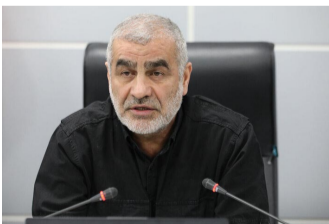
نایب رئیس مجلس شورای اسلامی، محمدحسین قزوینی، در جریان نشست روز شنبه ۲۲ اردیبهشت ۱۴۰۵، در تهران.

وی ادامه داد: سال‌ها بود که تنگه هرمز با نجات‌ملمت ایران مورد استفاده شما قرار می‌گرفت. این شما بودید که جنگ افروزی کردید و امروز باید به نظم جدید این آبراه استراتژیک عادت کنید. این تنگه با عملیات نظامی باز نخواهد شد و این شما هستید که باید انتخاب کنید که یا پس از خروج‌تان از منطقه با پرداخت عوارض، عبوری‌ایمن داشته باشید و یا این بین‌بست را همچنان ادامه داده و خوراک ترس‌ها