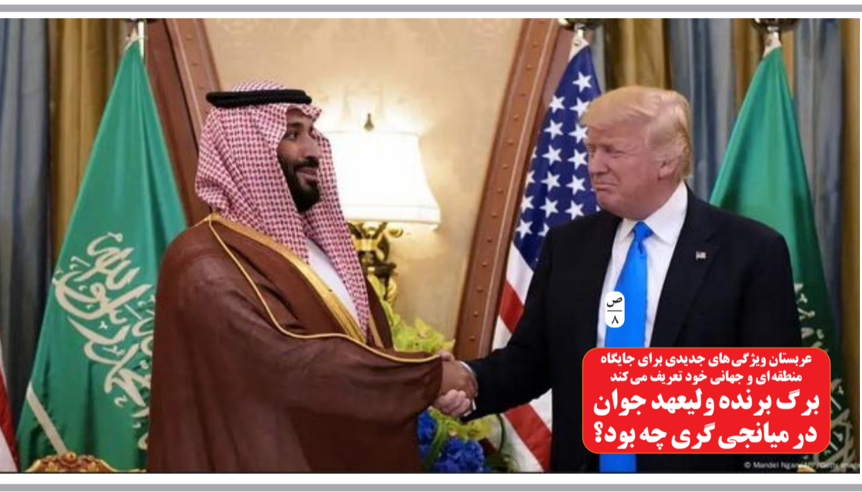
عربستان ویزگی های جدیدی برای جایگاه منطقه ای و جهانی خود تعریف می کند. برگ برنده ولیعهد جوان در میانجی گری چه بود؟

در صفحه ۲ کلان شهرهای ایران در معرض فرونشست؛ راهکار نجات چیست؟ در صفحه ۲ اعلام آمادگی ایران برای توسعه زیر ساخت های کریدور خزر - خلیج فارس در صفحه ۲ خطر مرگ هزاران بیمار دیالیزی از ۱۵ اسفند بیخ گوش وزارت بهداشت