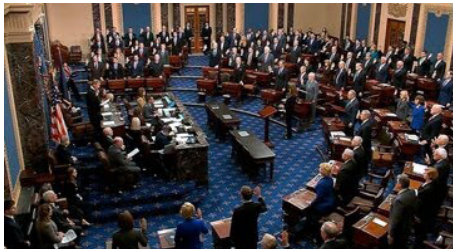
در حالی انجام شد که پیشتر سنا هفت بار تلاش مشابه را رد کرده بود.

مجلس سنای آمریکا برای نخستین بار پس از هفت بار تلاش ناموفق، طرح محدود کردن اختیارات جنگی ترامپ درباره ایران را پیش برد.