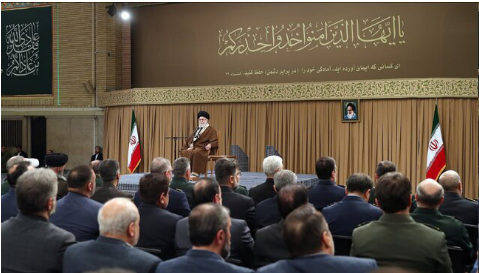
ای کشانی که ایمان آورده بود، اعدای خود را (در برابر دشمن) حفظ کنند.

رهبر انقلاب در دیدار دانشمندان، مسئولان و متخصصان صنعت دفاعی کشور تأکید کردند که راهپیمایی ۲۲ بهمن پیام اتحاد ملت ایران به تهدیدهای احمقانه دشمن بود. حضرت آیت‌الله خامنه‌ای در دیدار دانشمندان، مسئولان و متخصصان صنعت دفاعی، با تأکید بر استمرار نوآوریانه پیشرفت‌های دفاعی، راهپیمایی ۲۲ بهمن اسمال را قیام مردمی و حرکت بزرگ ملی در زیر بمباران‌های رسانه‌ای دشمن خواندند و با تجلیل و تشکر صمیمانه از مردم گفتند: ملت اتحاد خود را فریاد زد و در مقابل تهدیدات مکرر دشمن، هویت، شخصیت، توان و پایداری ایرانیان را نشان داد.