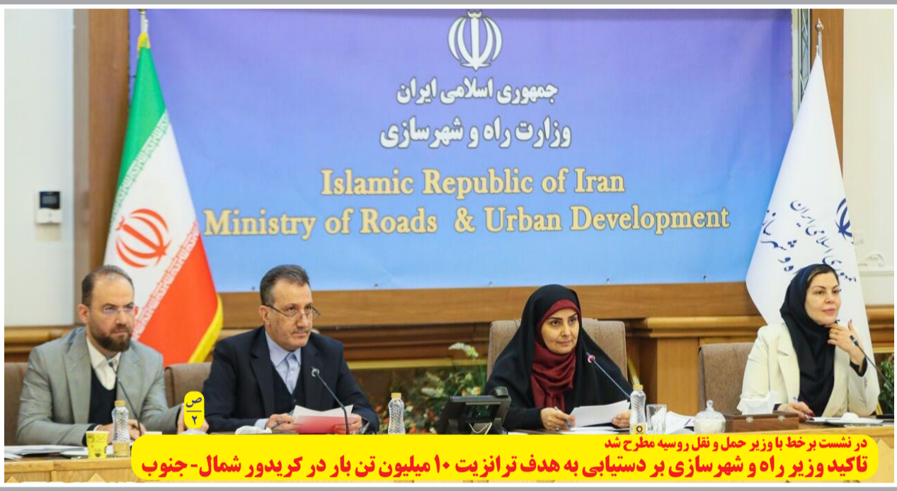
در نشست برخط با وزیر حمل و نقل روسیه مطرح شد تاکید وزیر راه و شهرسازی بر دستیابی به هدف ترانزیت ۱۰ میلیون تن بار در کریدور شمال-جنوب