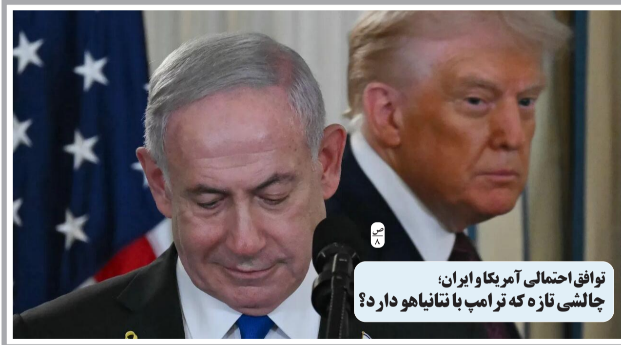
توافق احتمالی آمریکا و ایران؛ چالشی تازه که ترامپ با تانیا هو دارد؟