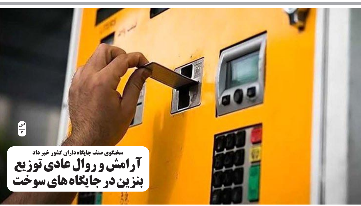
سختگوی صنف جایگاه داران کشور خبر داد آرامش و روال عادی توزیع بنزین در جایگاه های سوخت