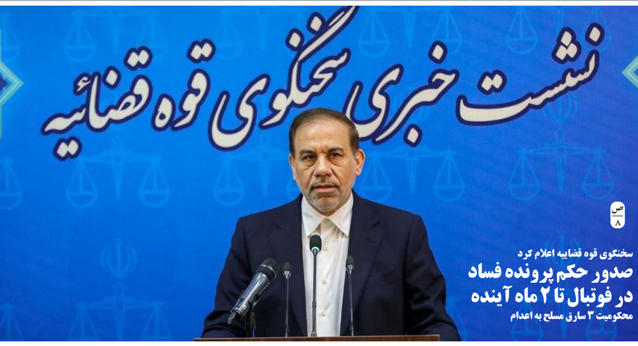
سخنوی قوه قضائیه اعلام کرد صدور حکم پرونده فساد در فوتیال تا ۲ ماه آینده محکومیت ۳ سارق مسلح به اعدام

همزمان با برپایی هشتاد و پنج نفره بین المللی نارسایی قلب ایران نمایشگاه جانبی تجهیزات پزشکی برپا خواهد شد که در آن دستگاه های تشخیصی و درمانی مانند اکوکاردیوگرافی، آنژیوگرافی و غیره مطابق با تکنولوژی های روز دنیا عرضه می شود. همچنین شرکت های دارویی جدیدترین داروهای درمانی نارسایی قلب را به متخصصان این رشته معرفی خواهند کرد.