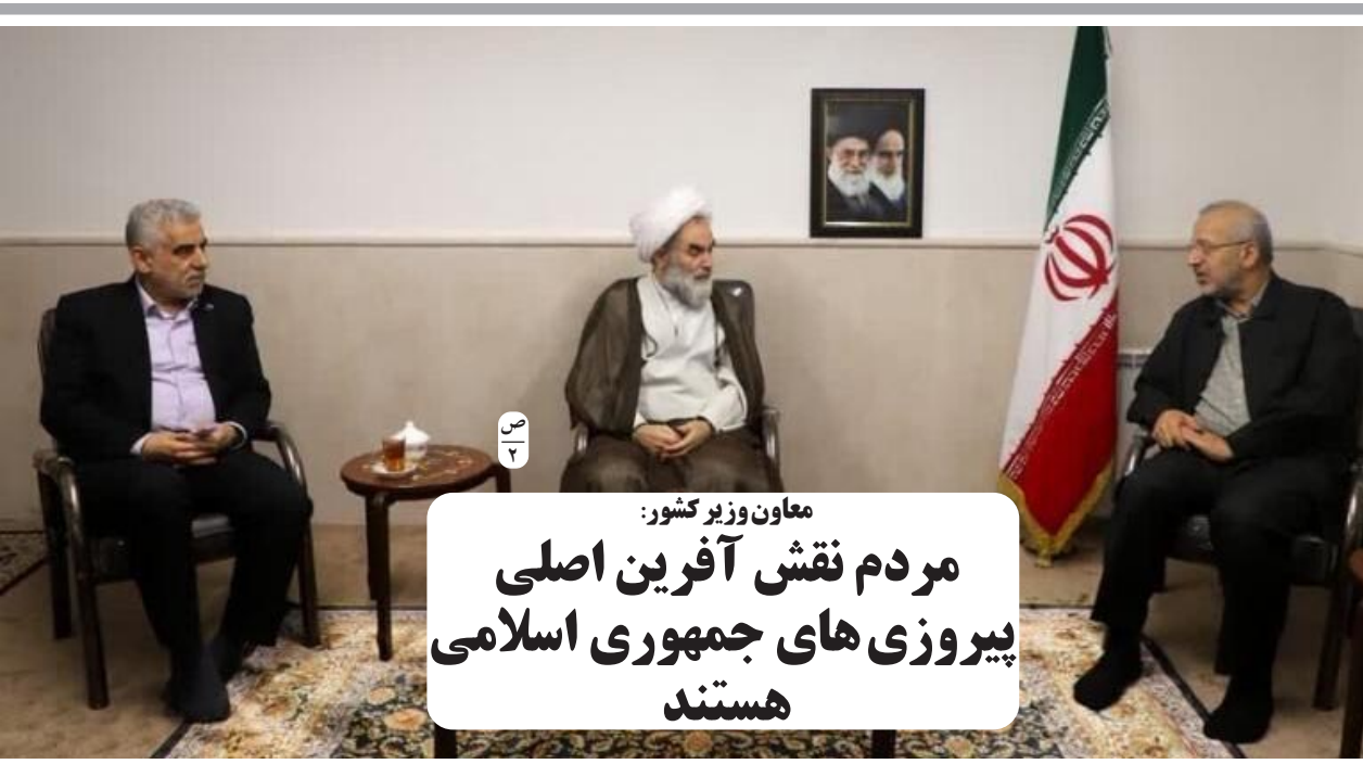
معاون وزیر کشور: مردم نقش آفرین اصلی پیروزی های جمهوری اسلامی هستند

راغفر: بانکها، اصلی ترین عامل سرطان اقتصاد کشور هستند