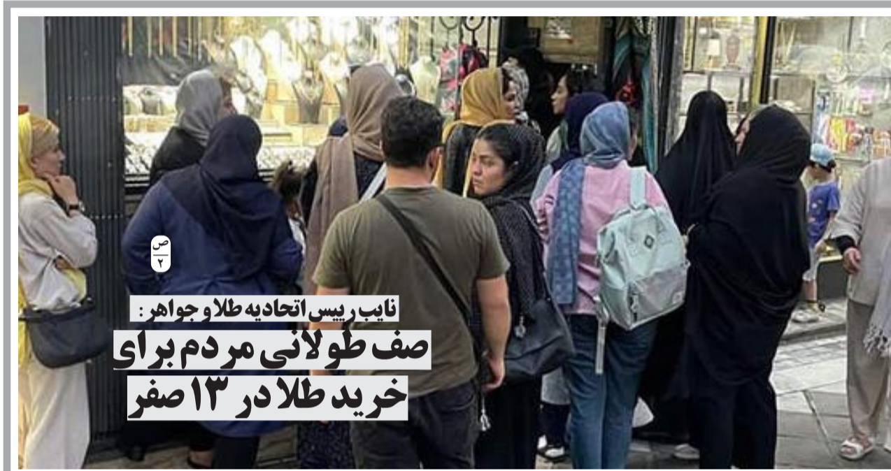
نایب رئیس اتحادیه طلا و جواهر: صف طولانی مردم برای خرید طلا در ۱۳ صفر